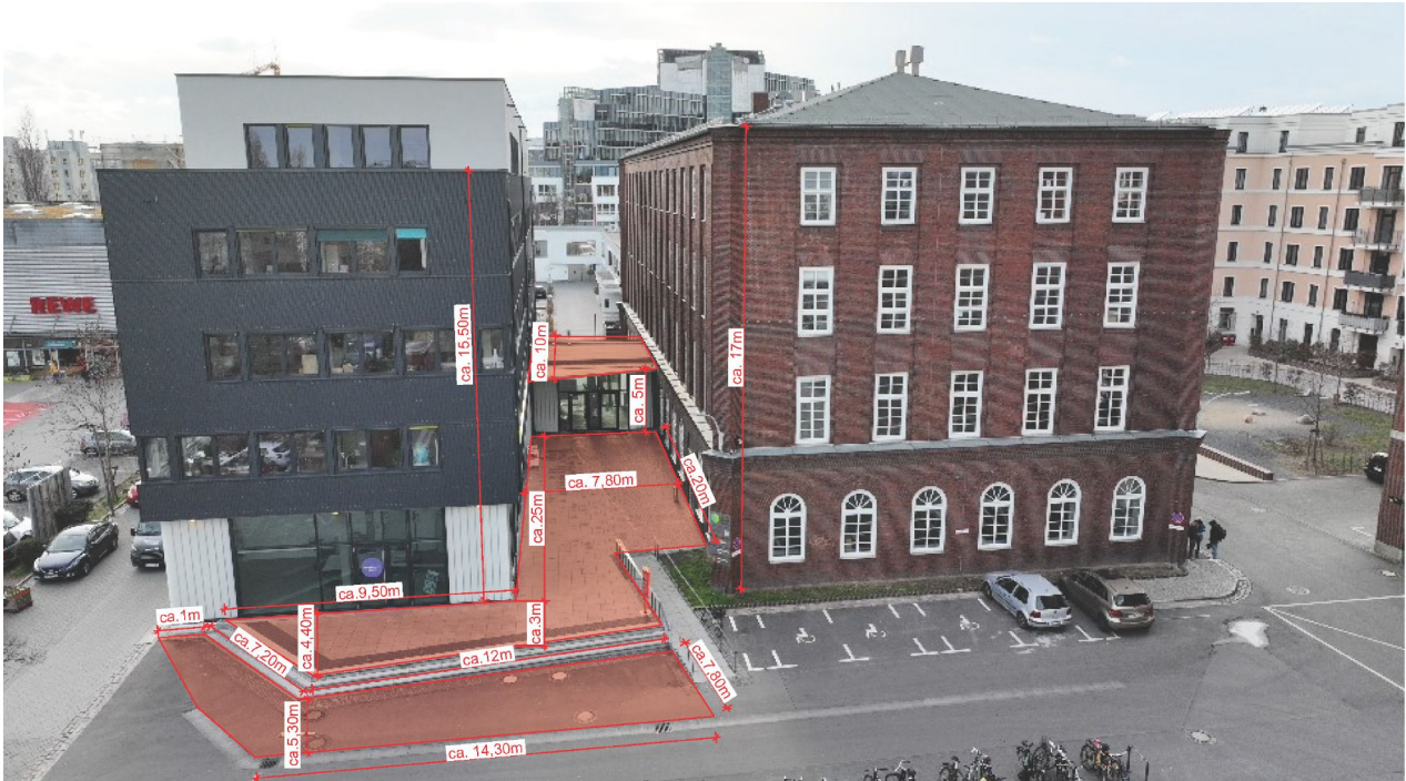
Diagram with approximate dimensions