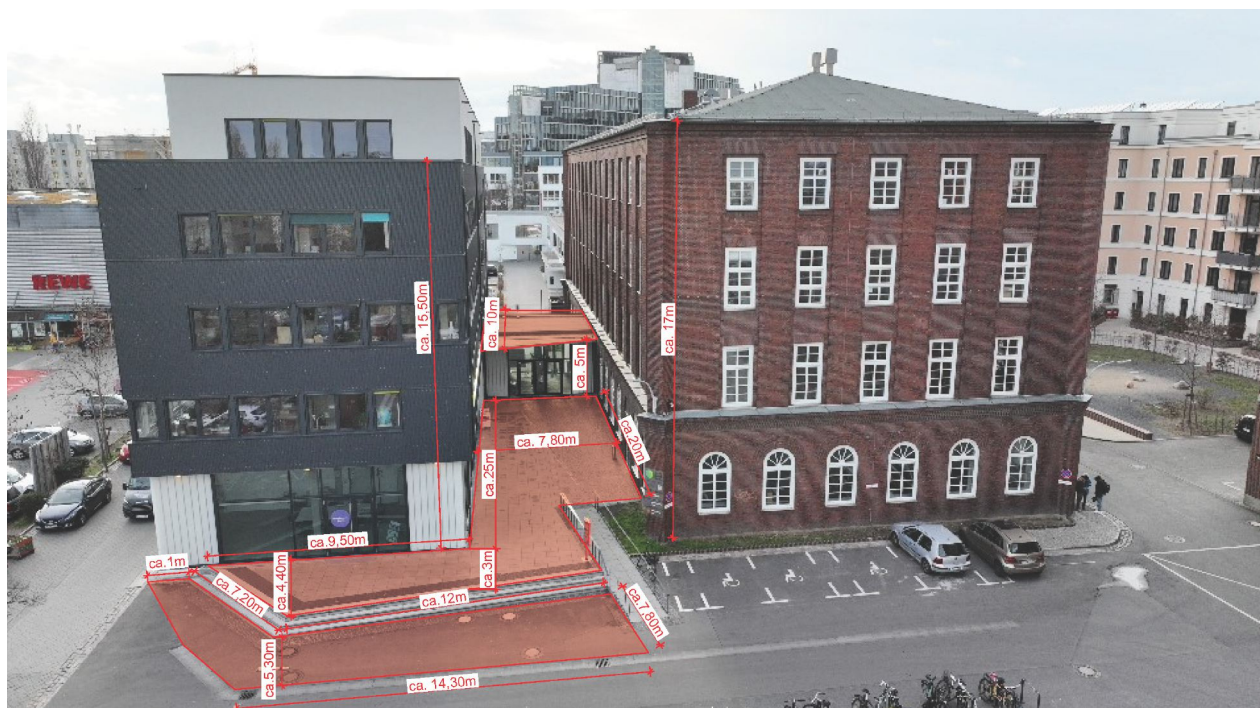
Schéma avec dimensions approximatives

Le site de l'intervention artistique correspond aux espaces extérieurs de Berlin Global