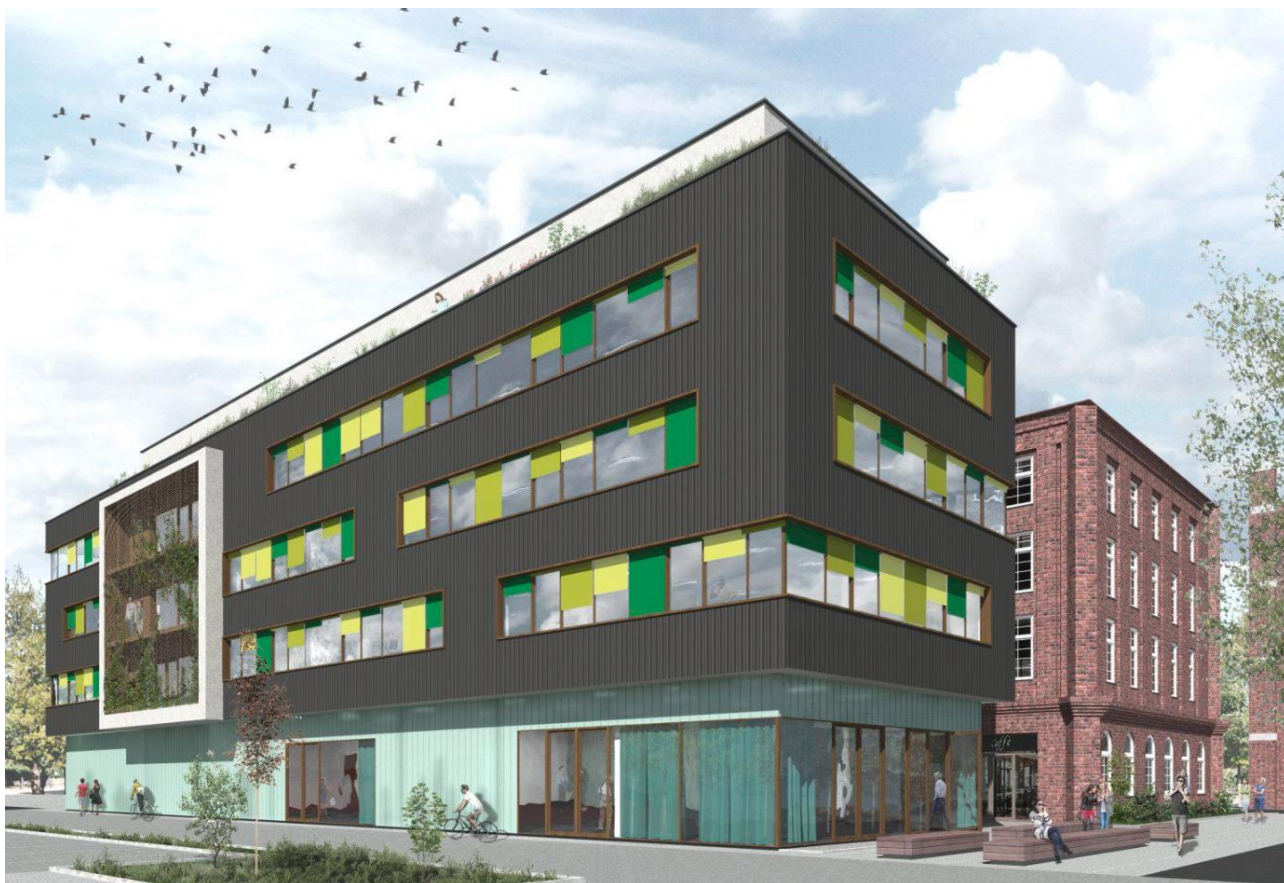
Previsualización estudio de arquitectura Anne Lampen

Berlin Global Village pone a disposición salas para oficinas para cerca de 50 organizaciones e iniciativas de desarrollo y de diáspora migratoria – desde pequeñas asociaciones a base de voluntarios, hasta grandes organizaciones no gubernamentales (ONG) y organizaciones paraguas estatales y federales. Con salas de eventos y seminarios, ludoteca, "Sala Mundial" digital, mediateca, galería y un Café de Encuentros de comercio justo, se genera una oferta diversa para la sociedad civil de políticas de desarrollo y diáspora migratoria.